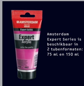
Amsterdam Expert Series is beschikbaar in 2 tubenformaten: 75 ml en 150 ml

Expert is verkrijgbaar in 70 kleuren in 75 ml en 150 ml tuben. Expert is goed te gebruiken in combinatie met Amsterdam Standard Series, de Specialties en de hulpmiddelen.